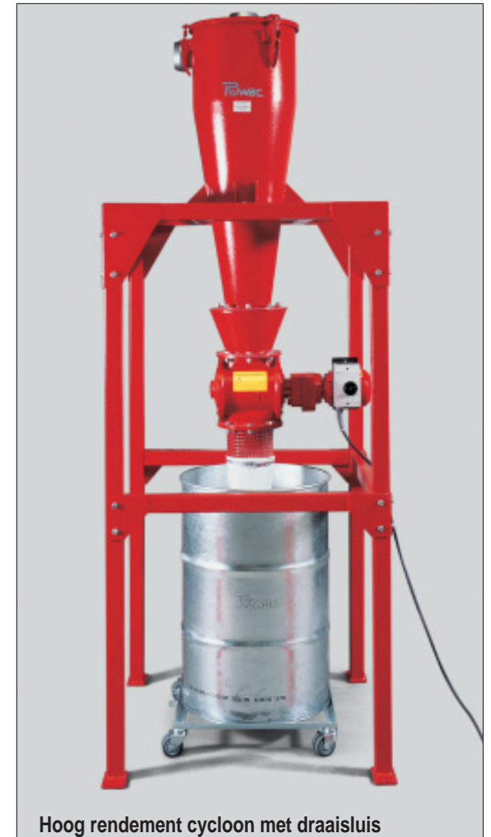
Hoog rendement cycloon met draaisluis