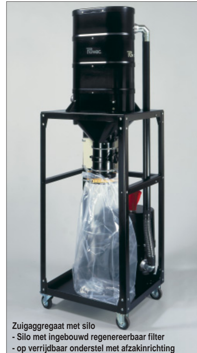
Zuigaggregaat met silo - Silo met ingebouwd regenererbaar filter - op verrijdbaar onderstel met afzakinrichting