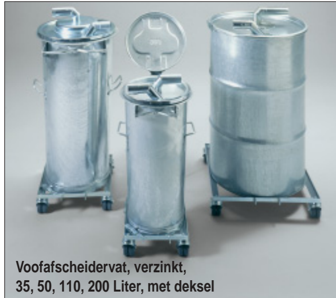
Voorafscheidervat, verzinkt, 35, 50, 110, 200 Liter, met deksel

Met een voorafscheider tussen het afzuigpunt en het afzuigstelsel wordt het voornaamste af te zuigen materiaal gescheiden om het filter minder te belasten. Onafhankelijk van het feit of dit materiaal droog, vochtig of nat is, wordt het in de afzonderlijke (meest geschikte) voorafscheider of een afvoersysteem verzameld of gescheiden, geborgen of opnieuw gebruikt.