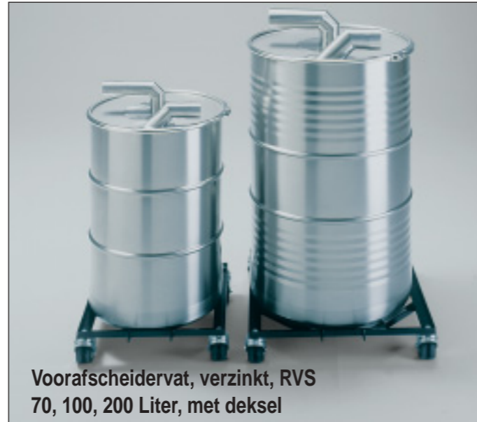
Voorafscheidervat, verzinkt, RVS 70, 100, 200 Liter, met deksel