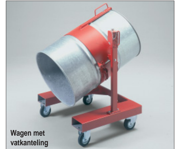
Wagen met vatkanteling