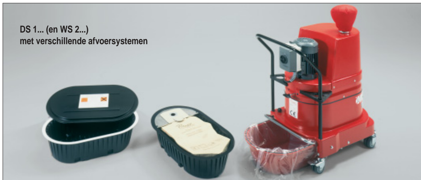
DS 1... (en WS 2...) met verschillende afvoersystemen