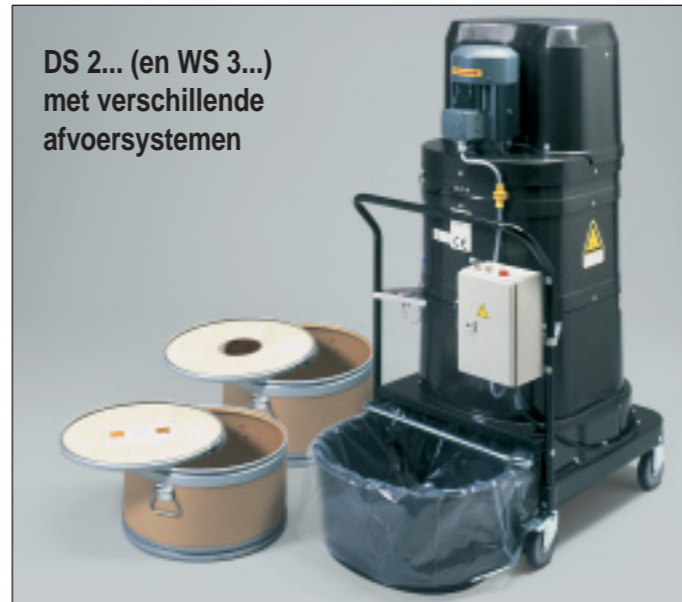
DS 2... (en WS 3...) met verschillende afvoersystemen