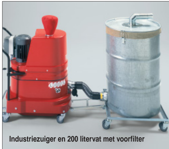
Industriezuiger en 200 litervat met voorfilter