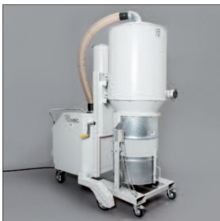
200 liter-vat met kiepinrichting en uitsparingen voor de heftruck