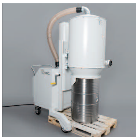
200 liter-vat op europallet