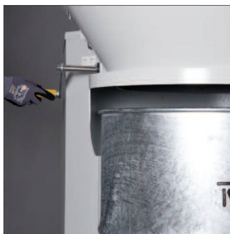
Exacte aanpassing aan de verschillende afscheidingseenheden