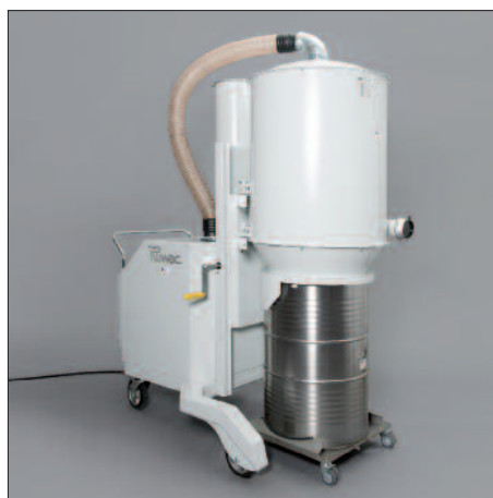
200 liter-vat met wagen