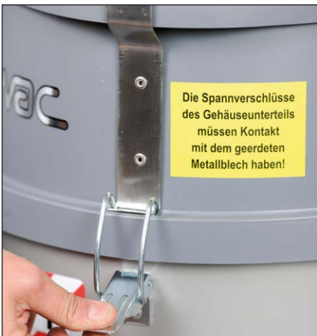
Veiligheid door spansluitingen

Die Spannverschlüsse des Gehäuseunterteils müssen Kontakt mit dem geerdeten Metallblech haben!