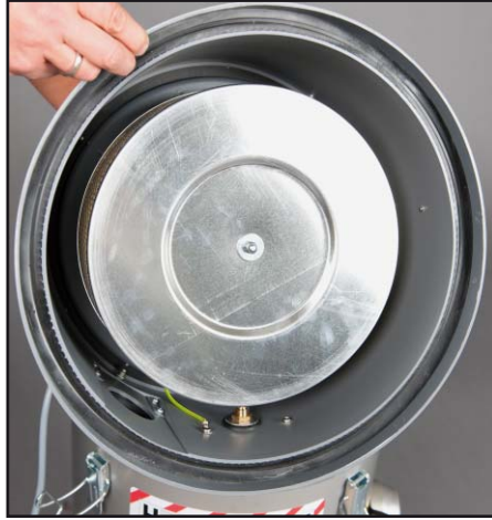
Reststofffilter stofklasse H