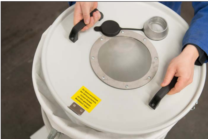
Eenvoudige filtervervanging door oplichten van het deksel