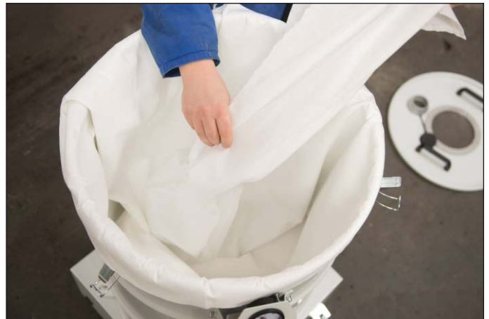
Eenvoudige afvoer als afval