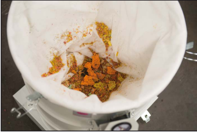
De snijresten worden in de vlieszak verzameld

De industriële stofzuigers van de serie DAV-SB worden zowel voor het opzuigen van pluizen als van snijresten (bijvoorbeeld papier, plastic, stof) in productie-installaties gebruikt. Zuigvermogen, constructie en afmetingen zijn aangepast aan de vereisten van de productiemachines waarop ze gebruikt worden. Snijresten worden opgezogen en in een filterzak van stofklasse M verzameld. Het opgenomen materiaal wordt goed verdicht zodat het volume van het filter optimaal uitgebuit kan worden. Het volle filter kan eenvoudig uit de stofzuiger worden genomen.