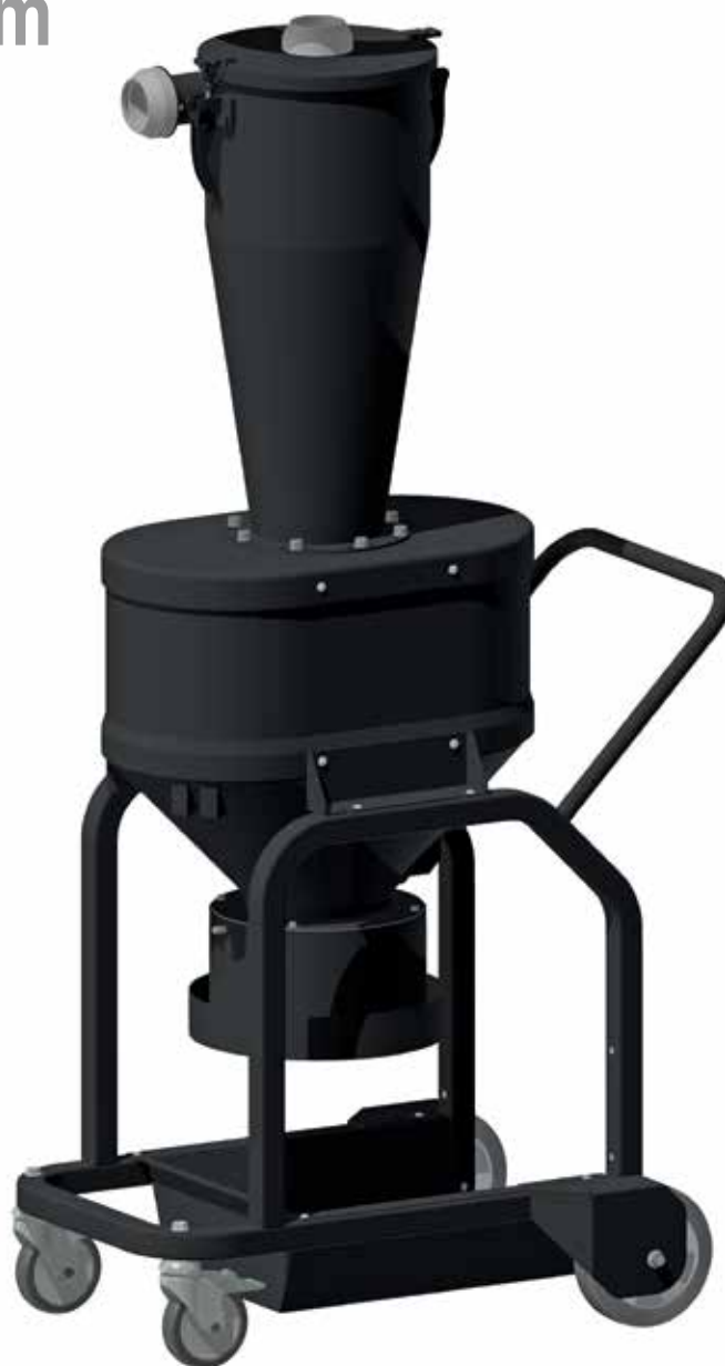
Cycloon met uitlaat voor Longopac ®